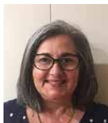
Coordinatore trasporto comunitario

“È un grande piacere lavorare con un'organizzazione di servizi comunitari altamente stimata. Mi piace aiutare le persone anziane a soddisfare le loro esigenze quotidiane! Il mio ruolo lavorativo è gratificante, e mi consente di dare un contributo positivo alla comunità.”