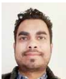
Autista trasporto comunitario